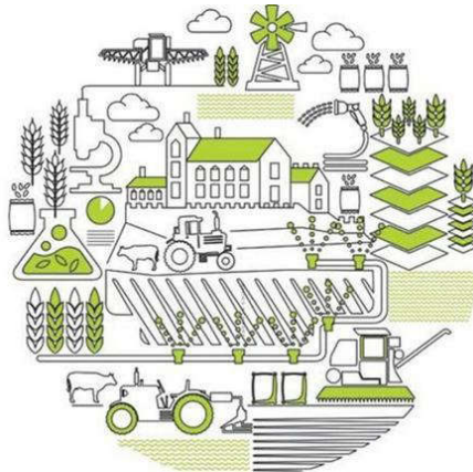
大数据视角下如图一所示