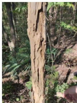
图1: 枯死树木白蚁危害

经长期调查,岳阳市城区及近郊园林绿地中,危害园林树木的白蚁主要有四类。黑翅土白蚁为土栖性,巢穴在地下1-2米,通过泥被、泥线取食腐朽木质部,4-6月傍晚闷热或暴雨时分飞,是监测防治关键期。黄翅大白蚁筑大巢群居,成熟蚁巢在地下1米深处,破坏树干表皮、韧皮部,可达木质部,4-6月凌晨2-5时分飞。黄胸散白蚁易危害老、病树,从枯死部位取食,逐步向活木质部转移,2-4日中午闷热天气分飞。家白蚁(台湾乳白蚁)从土壤树根或基部进入,沿树干向上蛀食,群体庞大、食量大,5月下旬至7月上旬大雨前后或闷热黄昏分飞。这四类白蚁是岳阳园林树木白蚁危害主体,为防治策略制定提供了依据 [2] 。