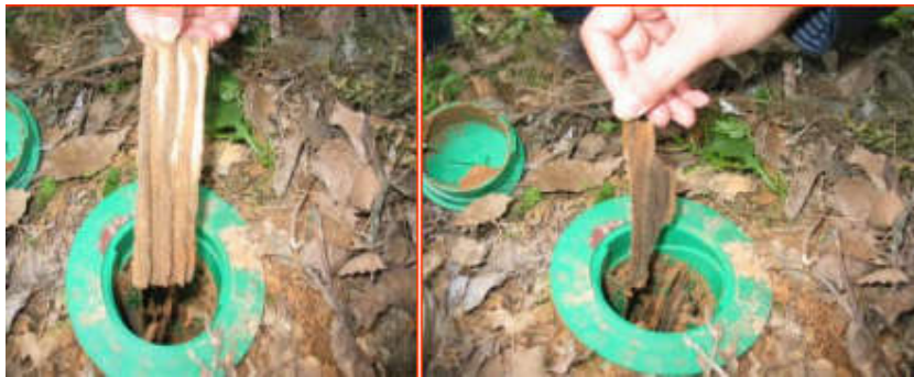
图3: 饵站内木片被取食

2009年8-9月岳阳市白蚁防治技术人员在金鹗公园、南湖公园安装地下型饵站诱杀黑翅土白蚁,饵料(木片)轻度腐蚀后,发现有白蚁取食现象,将饵料换成0.1%氟虫脲处理木片,经过近一年的维护检查,实时投放饵剂,白蚁对周边树木侵害减少,灭杀白蚁有一定的效果。