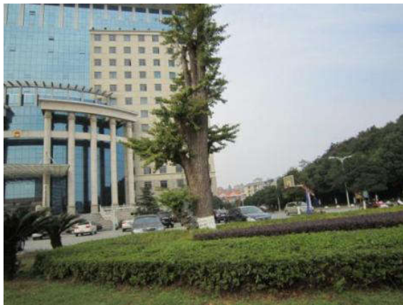
图4: 银杏树恢复生长

2010年9月岳阳市人大广场银杏树发现家白蚁危害,树心被蛀空,技术人员采用含有0.5%氟铃脲饵剂进行诱杀,经过8个月定期检查、补充装填饵剂,观察无白蚁取食现象,判断银杏树内家白蚁整巢灭亡,银杏树恢复生长。