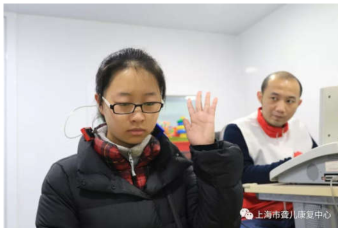
图2 功能测试与完善

和下课指令等，这样听障学生就可以通过震动的频率，对教师的指令进行理解。如图2所示，所以，在进行系统设计时，设计人员要对听障学生群体特点进行深入的了解，并且根据学生的学习特点进行系统设计。才能保证这项系统在应用时，能够为这个学生群体提供更加的便利，使其能够更好的理解教师的指令，提高课堂学习的效率和质量，帮助听障学生更好的进行课堂教学内容的理解和学习 [3] 。