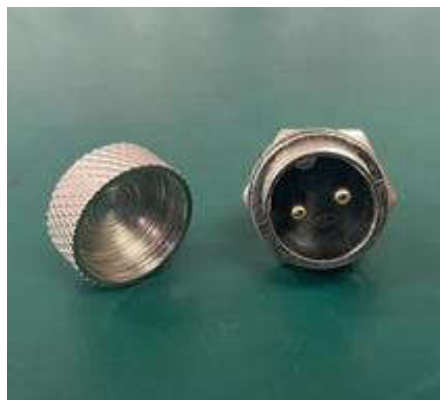
图3 电源插座增加金属罩壳效果图