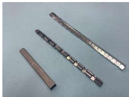
图2 金属屏蔽弹簧片和带背胶的导电泡棉条