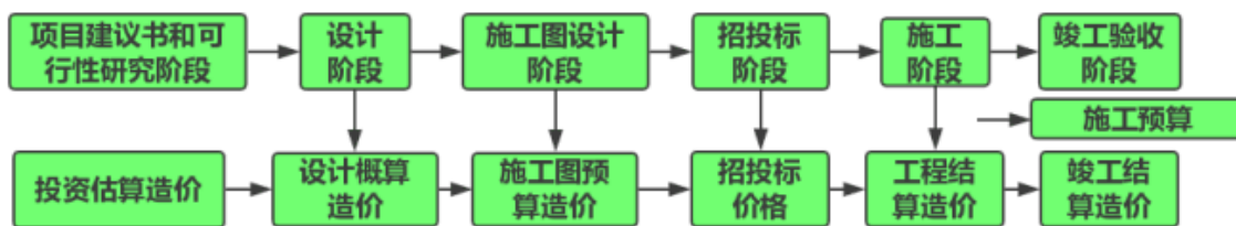
图1 概预算与建筑工程基本建设程序之间的联系

作为工程造价管理的核心环节之一, 概预算和工程造价质量有着密不可分的关系, 并且建筑工程概预算与基本建设程序有着如图1所示关系存在, 同时, 在最近这些年, 随着互联网信息技术的快速发展进步, 相关工程的数量与规模都在与日俱增, 各种各样的先进技术也被越来越多的应用到了工程施工建设当中。