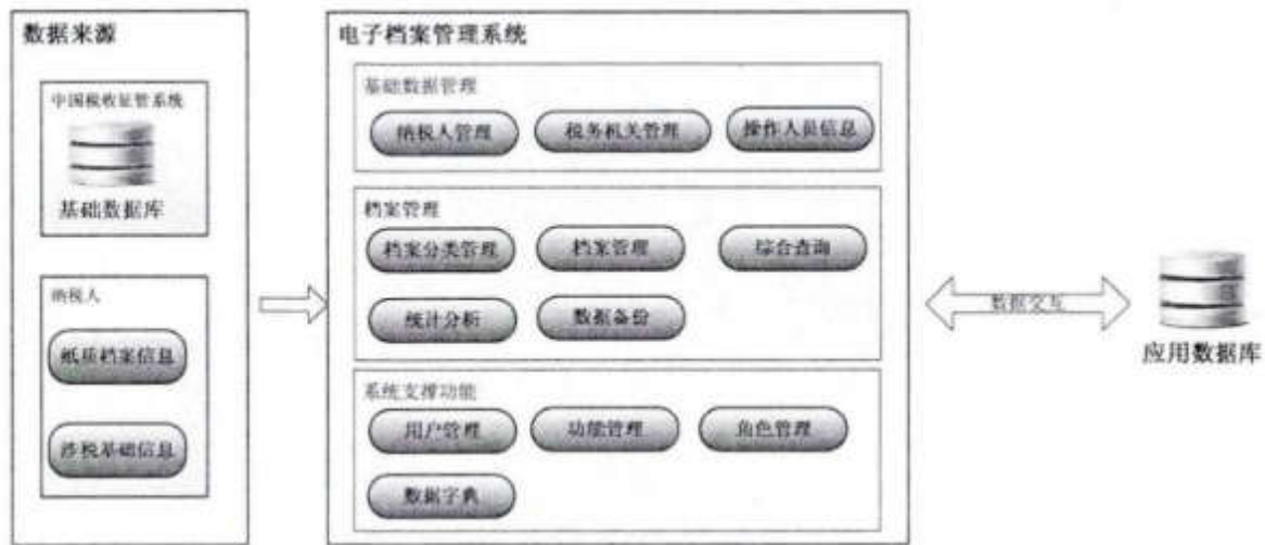
图2 电子档案管理系统建设框架图

第二，利用已完成的数字化档案目录和全文资源，编制计算机检索工具，提高档案信息的查全率和查准率，简化群众利用的步骤，并且进一步争取构建各个乡镇间档案信息资源互通网络，实现群众利用乡镇档案资源的最快捷化 [5] 。