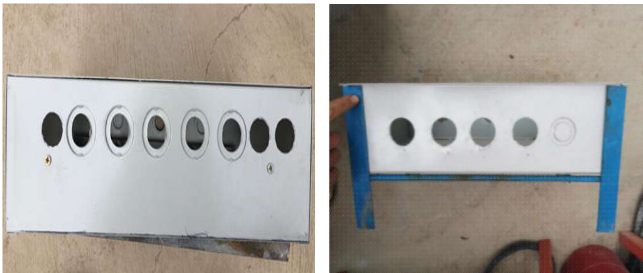
图4 外部固定装置（保证箱体与墙面平齐）