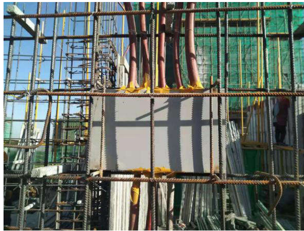
图7 一管一孔，整齐排列