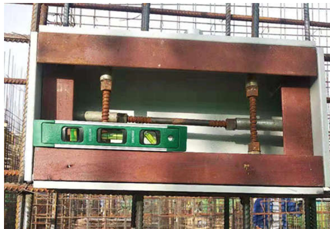
图6 箱体平整度测量