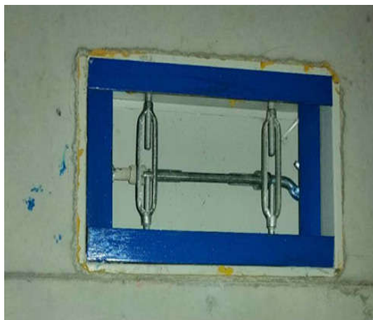
图9 可调节支撑模具