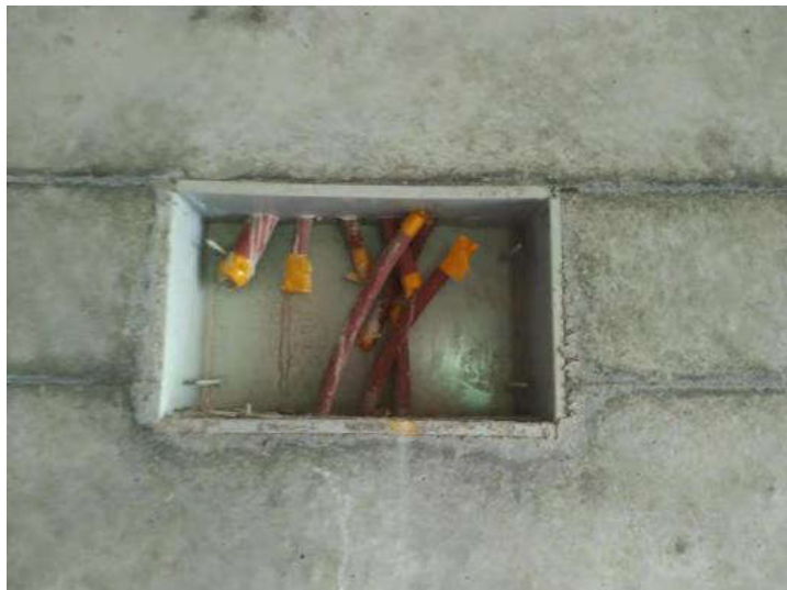
图1 箱体安装实景图

墙内配电箱一次性预埋的做法，但不同程度的存在箱体扭曲、变形、与墙面不平等缺陷 [2] 。针对上述施工过程中出现的各种质量问题，工程公司成立了勇攀高峰QC小组，专门研讨解决配电箱箱体一次预埋质量控制技术，通过对几个项目配电箱箱体一次预埋质量的研究及控制，总结出了一种新的预埋方法，经实践取得了很好的效果（如下图1、2所示）。