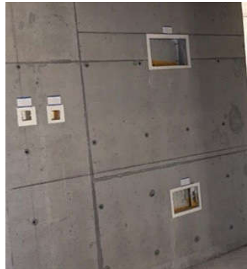
图2 箱体安装实景图