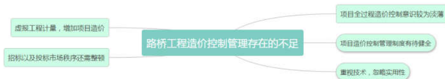
图1 路桥工程造价控制管理存在的不足

在城市进程逐步加快的大环境下, 路桥工程项目的数量逐步增加。然而, 在当的路桥工程造价实际管理与控制作业中存有的诸多问题以及不足, 这些问题主要体现在下图1。