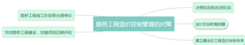
图2 路桥工程造价控制管理的对策

针对当前我国路桥工程项目造价管理与控制过程当中存有的诸多问题以及不足，需要采取科学合理的措施与方法，具体的对策主要体现在下图2。