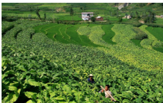
图3 新农村田园风光型景观

在新农村的建设时,要合理的安排分布生产、聚居和游览不同区域的景观空间。必须要加强对于当地土地资源与水资源的利用,在对于不同景观的分布设计时应科学合理,同时要对各个区域之间通过道路交通网络进行联系与协调,还应该通过绿地和树木等景观要素将不同区域进行分隔。通过休闲农业旅游产业,进一步对新农村的公共服务体系进行完善,不断对基础设施进行建设,提高人们的旅游兴趣。另外在进行设计的时候,还要体现“逆向”原则,也就是别人没有的东西我要有,别人有的东西我要更加优秀这样一种设计理念,不断提高当地的生态旅游资源的趣味性。并且在设计生态景观的时候,必须要将当地特色的景观元素突出出来,比如对于一些历史文化比较久的新农村,就要不断挖掘历史文化元素,并且要保护相关的传统建筑,同时再新建一些局部的雕塑或是植物等景观小品,充分展示当地的传统文化。但是在发展新农村的休闲产业时,必须要注意保护当地的生态环境,不能过度开发,也要保护当地特色的生态与民俗风情 [12] 。如图3,就是我国新农村建设的田园风光型生态景观。