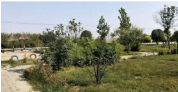
图1 植物搭配种植不科学

在进行新农村的建设过程中,很多农村都没有根据实际情况进行植物的选择与种植,而是盲目的学习城市当中的绿化方式,比如说设置了一些草坪和模纹花坛等人工景观,这些景观会严重破坏农村的田园风光,不利于农村建设出符合自身的景观特色。另外还出现了直接照搬其他农村的情况,那些农村根据自身情况对景观进行了设计与规划,因此景观能够符合他们村庄的要求。但是直接照搬这些景观,就会导致不能合理规划与利用自身的树种,导致所有农村的景观都相同,对当地特色的景观会造成较大的威胁,不利于特色景观的延续 [8] 。图1就是农村在设计生态景观时没有合理的设计,导致植物搭配十分不合理。