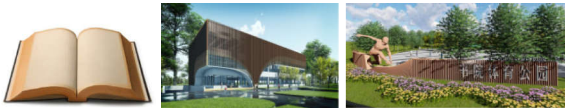
图18-20 书院文化效果图

化。体育馆造型的立意，来源于“书院镇”的书，以一本打开的书的造型为基础，寓意着“文化书院，书香满溢”。通过抽象与演化，形成建筑外立面竖向百叶的动态，以多重曲线的交叉汇聚模拟书页的翻动，也为体育场建筑注入动感和活力，呼应体育公园的主题。