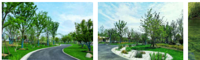
图15-17 绿化种植建成图