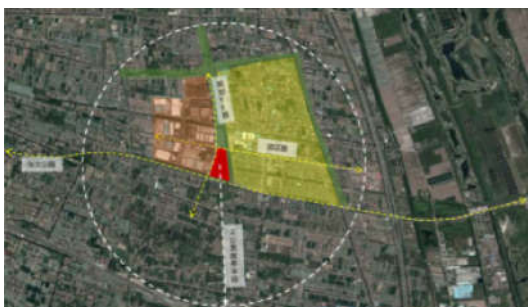
图5 使用人群分析图

经调查研究, 书院镇中心地区绿地资源不多, 尤其是5km范围内, 体育为主题的公园更是缺失。书院社区既有公共文化活动中心等设施难以满足群众日益增长的物质文化生活需求, 公益性文化设施仍存在布局不尽合理, 郊区设施数量较少、规模密度不足, 服务水平远不如中心城等不足。书院社区体育公园的建设, 是书院镇第一个设施全面、场地开阔的综合性运动场所。本项目的选址布局, 首先, 服务于周边的居民, 在服务半径2公里以内, 服务约70000城市居民, 主要为居住区、工业区、产业区, 使用的人群也是多种多样, 确保居民能够方便快捷地到达并进行活动。项目周边交通也是非常便利, 场地内部地块H0601规划有公交枢纽, 未来交通便利, 可吸引大量人流; 其次, 场地内现存的自然资源也是十分具有优势, 具有一定的乔木资源, 有一定的绿化基础, 另外场地现状具有一片水资源。