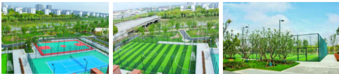
图10-12 球场建成图