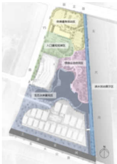
图4 分区图