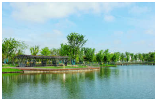
图13 生态水岸建成图

铺装材质突出运动场地的特异性需求以及公园的自然环境，选择环保性好且易于维护的生态材料，结合海绵城市的生态理念，以透水铺装为主。