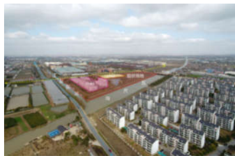
图1 现状图片