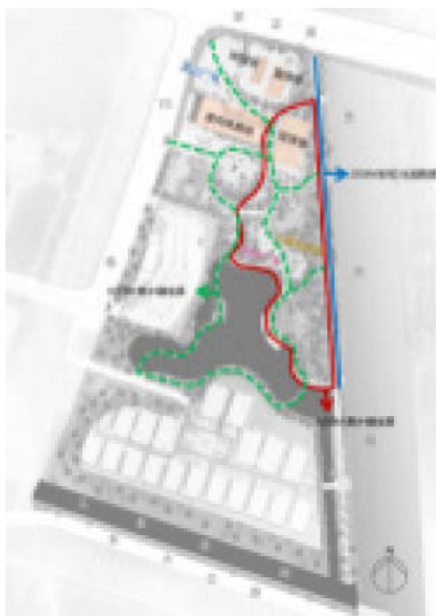
图9 运动场地分析图