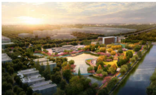
图3 鸟瞰图（图片来源：上海浦东建筑设计研究院有限公司）

H0602 地块为体育设施用地，地块面积 1.06 公顷，建设内容包括新建体育场馆，活动、运动场地建设以及体育配套设施建设。H0604 地块为公园用地，地块面积 5.01 公顷，主要建设内容包括地形、园路铺装、配套建筑、亭廊小品、绿地、水体以及健身、儿童活动器材等。书院社区体育公园提供了各类运动场地和设施，还融入了休闲、文化、娱乐等多种功能，属于综合型社区体育公园。