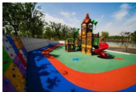
图8 儿童区建成图