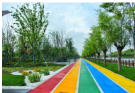
图7 彩虹跑道建成图

考虑到各个年龄阶段的使用, 策划满足不同年龄层次居民运动需求的体育项目。本社区体育公园涵盖室内体育馆和室外运动空间。设计中青年热衷的跑步、足球、篮球、网球、羽毛球、乒乓球、器械、游泳等活动场地及设施; 也融入老年人喜爱的运动项目垂钓、舞蹈、太极、武术、瑜伽、漫步等体育活动场地; 儿童主要以儿童攀岩、沙坑、游乐设施、跑步、轮滑、自行车等运动场地。其中园区的特色滨水跑步道利用原有防汛通道, 为居民提供别致有趣的滨水跑步空间, 空间内设计了彩色铺装跑道, 趣味地面Logo, 沿路休息空间、滑板运动空间, 以及亲水平台空间。