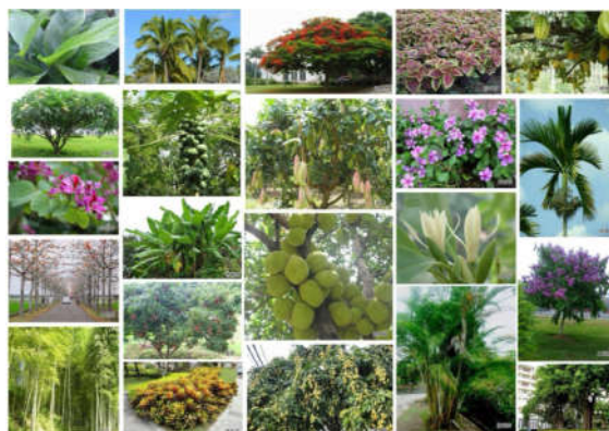
图2 特色农产品种植

术。如图2所示，例如可以借助一些现代的物联网技术，通过葡萄和菠萝蜜等特色农产品的种植，提高农产品的生产质量，带动区域内的农业进行更好的发展。在进行产业建设时，可以根据市场的导向，通过创建专业的音乐康养，对这个产业进行科学的规划和运营。根据区域内的民族和民俗文化基础，建设以这个产业为中心的特色体验项目。