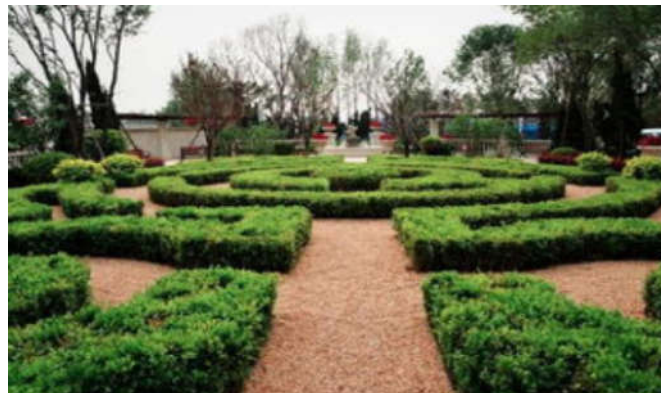
图1 宁夏园林景观图

园林绿化的建设十分重，从另一个层面说，通过园林绿化的层次结构可以丰富园林绿化建设与自然的和谐发展，因此要不断的提高园林绿化的观赏性和艺术性，来呈现出园林绿化与大自然的和谐发展，要让绿化建设与城市发展相适应，并且一定要遵循可持续发展的战略措施 [6] 。如在干旱的地区宁夏，不仅要考虑美化还要考虑实用性，要依据该地区的特殊性做出合理适当的设计。宁夏园林绿化建设如图1所示：