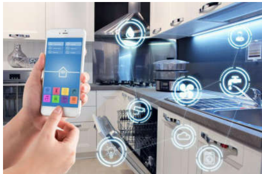
图2 智能住宅概念图

在展开建筑设计工作时，并非只是一种单一的概念，更需要利用良好的社会发展来提高社会的活跃性，培养工作人员良好的建筑思想 [6] 。我国建筑师行业之中，已经逐渐出现了越来越多的建筑概念，比如人们常能听到的“绿色住宅”和“智能住宅”这两个便是现在建筑行业推出的全新住宅设计方案。如图2，智能住宅概念图所示。