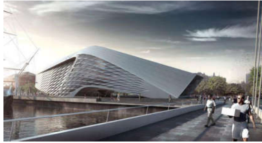
图1 现代建筑设计图

通过设计的角度来看建筑，便能够发现传统建筑都是在法律范围之内监督执行的。建筑的设计形式相对固定合理，设计师思维活跃想法更为多，所以不能很好地理解传统的设计形式 [3] 。如图1，现代建筑设计图所示。