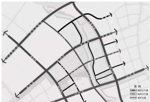
图2 城市规划设计中的道路规划图示

创造更加良好的生活环境，就需要重视城市规划设计的质量，促使其发挥出自身的作用，为人们生活质量的提升提供有力的保障。