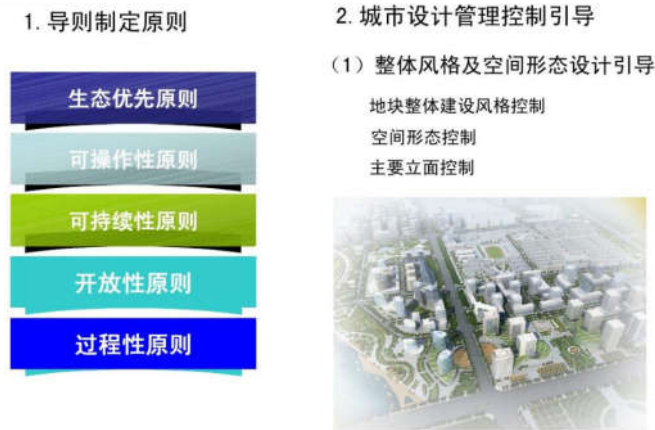
图2 城市设计导则图

在风格的统一性。以满足城市发展的需求为前提进行设计，将城市发展与城市规划进行巧妙融合，实现建筑设计与城市规划设计的整体性。建筑设计要从城市规划环节中出发，严格按照城市设计导则如图2将两者的反应风格进行有效统一，才能保障城市规划与城市建筑之间的协调发展。