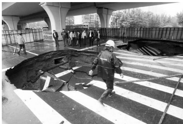
图1 道路施工质量问题

建筑工程在建成使用之后，其施工质量对于后期的使用还是会产生持续影响的，如果工程存在着质量隐患，那么在后期使用的过程中就可能显现出来，从而引发比较大的质量问题或安全事故。所以，在施工阶段开展施工质量管理，就能够有效控制工程的施工质量，防止质量隐患的发生，这样就可以有效保障用户的生命财产安全。如图1所示为某道路出现的施工质量问题，路面塌陷，该问题发生之后，对车辆和行人会带来严重的安全威胁。