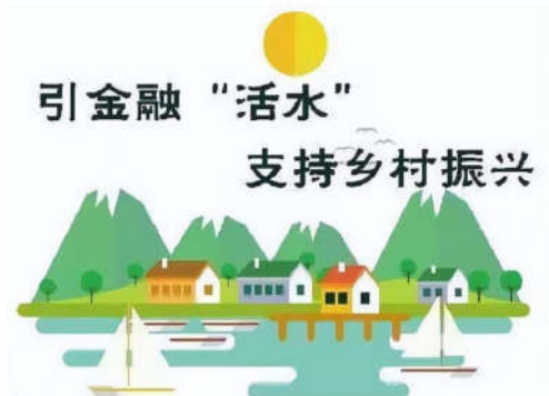
图2 农村金融助力乡村振兴

此提出一系列切实可行的策略,以期实现农村金融的全面升级,助力乡村振兴战略的深入实施(如图2)。