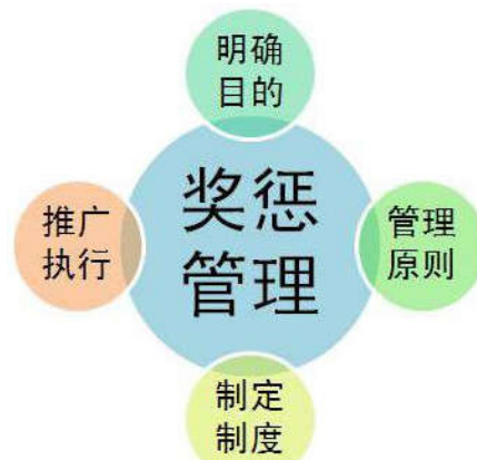
图3 某企业奖惩制度

因此，应创设和完备监管制度，以确保企业全面、严格的管理。管理人员有责任有效控制管理的范围。假如监管不到位，必然会有问题出现，影响企业的发展。假如不是不可抗力的缘由，高级管理人员必须承担监管不力的责任。假如管理人员无法正确理解自己的问题，无法主动处置，那么即便有完备的监管体系，也无法真正的发挥其作用，只会流于表面。图3为某企业责任追踪流程图。