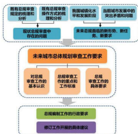
图1 市规划技术标准方案及其适度化流程

从现实的角度分析城市经济的发展是保证城市突破发展瓶颈实现进一步发展的基础保障性条件, 而科学合理的城市规划是城市经济发展的主要推动力以及基础保障性条件。现阶段, 在我国市场经济大环境下, 城市规划的主要目的就是为能够有效的提升城市经济发展, 一般情况下, 科学合理地规划城市配置各项资源, 必然可以有效地促进城市经济发展。规划对于城市经济发展的主要作用具体表现在以下几个方面。第一, 可以保证城市土地资源的应用变得更加透明化, 降低土地资源浪费, 保证城市空间布局符合城市特点以及发展需求 [2] 。第二, 城市规划能够扩展城市新的经济增长点, 有效带动城市经济发展, 并在此基础上实现各项城市发展资源的合理分配。第三, 城市规划对于城市经济发展有着宏观调控的作用, 可以保证城市经济市场持续有效且规范的发展, 进而不断地提升城市的整体发展高度。