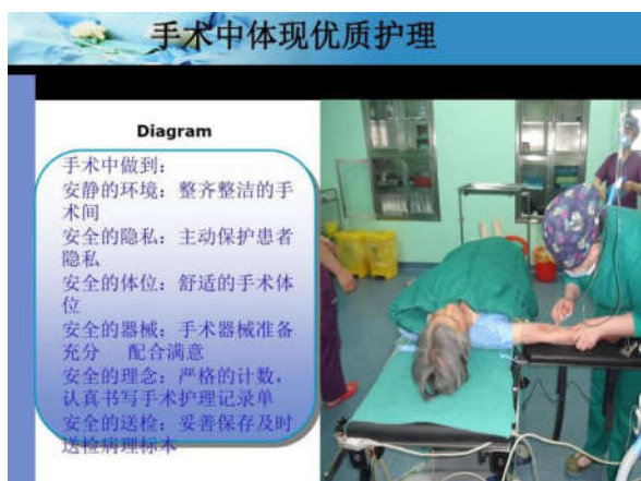
图2 手术中优质护理

线等，为患者创造一个舒适、安静且安全的手术氛围 [2] 。并且他们还会密切关注患者的生命体征和情绪变化，及时给予安慰和鼓励。在手术过程中，护理人员会保持与患者的沟通，用温柔的话语和轻柔的动作，让患者感受到关怀和支持。这种细致的关怀不仅有助于减轻患者的疼痛感，更能有效缓解其心理压力，使其保持平静和放松的状态，有利于手术的顺利进行（如图2）。