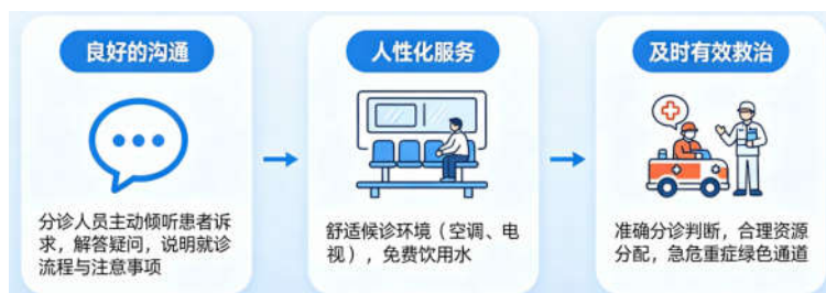
图2 急诊分诊提升患者满意度的流程图

(1) 良好的沟通。急诊分诊安全管理模式注重分诊人员与患者之间的有效沟通。分诊人员主动耐心倾听患者诉求，细致解答患者疑问，让患者清楚地了解自身状况及后续流程。在分诊时，主动向患者说明就诊流程与注意事项，使患者对就医环节心中有数，有效缓解患者因对环境陌生、病情担忧而产生的焦虑情绪，增强患者对分诊工作的理解与信任。(2) 人性化的服务。该模式倡导为患者提供人性化服务。从细节入手，打造舒适的候诊环境，配备空调、电视等设施，让患者在等待过程中身心放松；提供免费饮用水，满足患者基本需求。这些贴心举措让患者切实感受到医院的关怀与温暖，体会到医院以人为本的服务理念，使患者在就医过程中获得良好体验。(3) 及时有效的救治。通过准确的分诊判断和合理的资源分配，急诊分诊安全管理模式确保患者能够尽快得到恰当救治 [3] 。尤其是对于急危重症患者，开通绿色通道，优先安排救治，提高救治成功率。患者得到及时有效的治疗，身体恢复希望增大，对医院的信任度也会随之提升，满意度自然也会提高。图2为急诊分诊提升患者满意度的流程图。