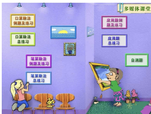
图1 信息化环境下小学数学教学