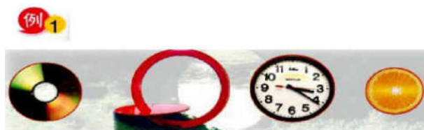
说说生活中, 哪些地方还能看到圆?

借助信息技术来开展小学数学课堂教学还需要充分的激发学生的思维能力和自主学习能力,引导学生进行问题的探究,可以帮助学生形成相应的数学逻辑思维,从而去解决更多的实际问题。就如如我们在学习圆这部分的知识时,由于涉及的内容比较的多,有圆的周长、圆的面积、圆的直径和半径,而且能够利用圆的知识来解决一些圆环问题。为了降低学生学习的难度,让学生对圆有着更加清晰和全面的认识,教师就可以利用多媒体来给学生展示一些我们生活中的实例,比如说自行车的车轮、我们学校的圆形花坛、生活中的圆形钟表等等,让学生对于圆这个图形有着最基本的认识,同时我们可以以表盘为例,给学生讲解圆心、直径以及半径等的相关概念,让学生自己动手来画一画,在此基础上,让学生来对圆的周长和面积进行很好的区分。之后再通过设计一个探究问题,也就是我们最为常见的圆环问题,同样用动态演绎的方法给学生展示大圆套小圆,并且鲜明的标出圆环面积的部分,之后让学生通过自主探究来寻找解题思路,通过启发和引导学生对这一经典数学问题化繁为简,开拓了思维,做到了知识的融会贯通,也就能提高数学课堂教学效果,如图3所示。