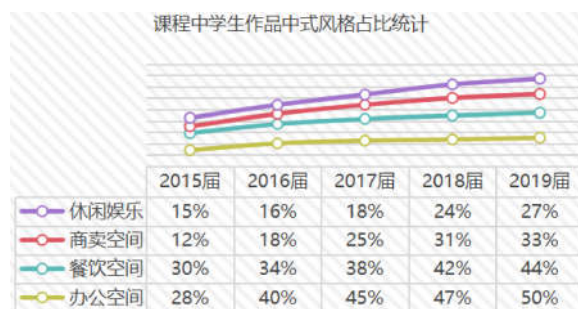
图1 课程中学生作品中式风格占比统计图

根据2015届—2019届建筑室内设计专业学生在本课程教学过程中四大模块的设计定位和风格选择的数据统计分析,中式风格的占比统计中,办公空间中式风格设计42%,餐饮空间中式风格设计37%,商卖空间中式风格设计23%,休闲娱乐空间中式风格设计20%(以上数据均取均值)。2015学年—2019学年公共建筑装饰设计课程模块中中式设计占比趋势呈现逐步缓慢升高的趋势。(见图1)小到软装陈设,大到天花顶棚类型,传统的中式装饰元素在新中式风格设计中都大量使用。学生在设计过程中逐步认识中式风格的特点和文化内涵。