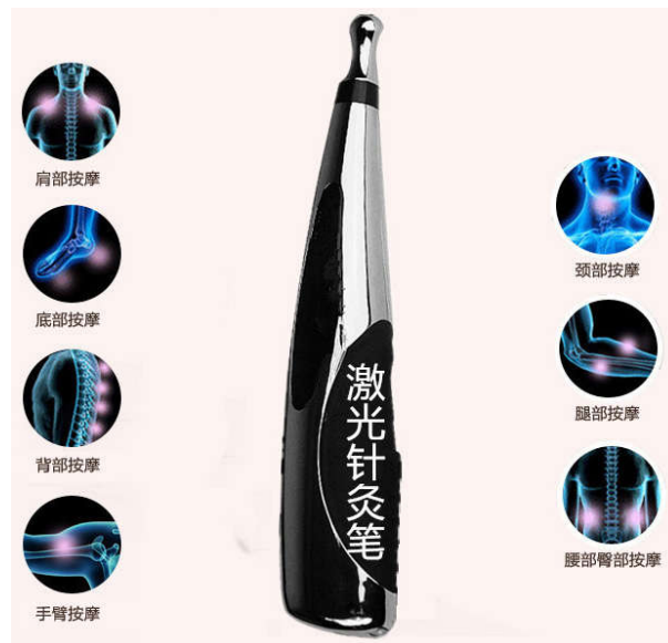
图3 新型针灸医疗设备

针灸教学的主要内容虽然是围绕着针法和灸法这两大部分展开的，主要目的也是为了治疗一些相关的疾病，但是随着时代的发展和人们需求的变化，针灸疗法目前也更多的使用于保健医疗的领域，在美容、减肥方面也有着相应的应用价值。并且随着医疗技术水平的提升和医疗设备的更新换代，除了传统的金属针刺、艾灸之外，还有着比较先进的声电波电针疗法、微波针法以及穴位激光照射法、穴位磁疗法、电离子透入法等等，这些内容都要在相关的实训课程中体现出来 [8] 。