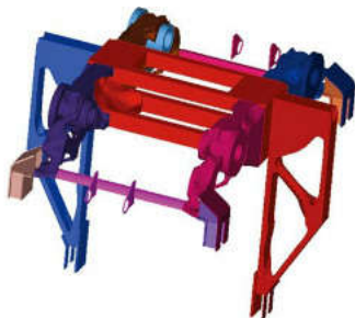
图4 工况1拓扑优化后的结果

Optistruct计算结束后, 要想对拓扑优化后的结果进行查看需要借助HyperView。0.3可以为密度阈值。其中拓扑优化后的结果见图4~图6。