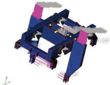
图3 拓扑优化构架有限元模型

拓扑优化时采用变密度法, 此种方法的发展基础为均匀化方法。其中变密度法的基本思路是, 引入一种密度可变材料, 该材料的密度在[0,1], 离散连续体结构, 将其变为有限元结构, 随后将设计变量看作每个单元的密度, 由此就实现了结构优化问题到单元材料最优分布问题的转变。其中拓扑优化构架有限元模型如图3所示。六面体网络是该有限元模型采取的划分模式, 128575为单元总个数, 164940为节点个数。在优化设计理论基础下, 将数学模型问题设计给优化对象, 其中具体描述如下: 设计区域柔度最小的为目标函数; 体积分数是约束条件, 体积分数 = (当前迭代的总体积-初始非设计区域体积)/初始设计体积, 为计算体积分数的公式, 对体积分数的要求是最大为0.3。纵向、横向两中心平面对称构架。