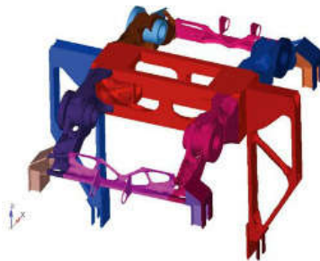
图5 工况2拓扑优化后的结果