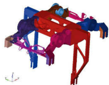
图6 工况3拓扑优化后的结果

分析上图可以发展, 3种工况下的稳定轮安装支架和齿轮箱座安装支架的拓扑优化结果是一样的。其中工况2和工况3的拓扑优化结果高度一致。工况2和工况3的拓扑优化结果与工况1相比较, 在施加惯性力和侧向力的情况下, 产生了竖梁。其中竖梁位于图2位置2和3处。斜撑结构出现在了两侧侧向力竖梁处。工况2和工况3的拓扑优化结果中, 安全轮安装支架位置出现了斜撑结构; 当前转向架与走行轮安装之间的形状具有很高相似性, 除去电机安装座稳定轮支架后, 起到的优化效果是非常显著的, 中间的斜撑可以起到较强的加固作用, 这与力的传递效果高度一致 [9] 。其中工况1中一共迭代25次。工况2中一共迭代28次, 工况3中一共迭代29次。在逐步增加迭代的过程中, 应变能的趋势为逐渐下降, 其中前4次拓扑优化变化最为明显, > 60%为应变能下降幅度, 第5次迭代到最后一次迭代, 平缓为应变能变化特