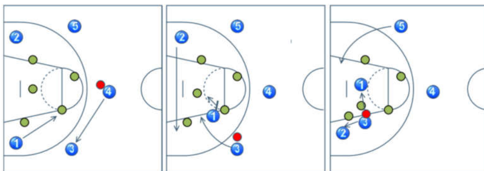
图2 挡拆切入战术示意图

篮板失手或失误后,进攻方迅速识别出防守方的漏洞,开始执行三攻二战术。传球与跑位:中间的进攻球员首先控球,他可以选择将球传给跑向罚球线延长线位置的右翼或左翼球员。接到球的翼部球员应迅速评估防守情况,选择继续传球给弱侧队友或直接上篮或投篮。配合与变化:在三名进攻球员之间,应通过精准的传球和快速的跑位,制造出空当和投篮机会。当防守球员试图协防时,进攻球员应及时调整传球方向和攻击点,以保持战术的灵活性和多变性。