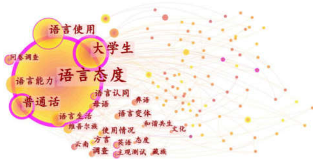
图3 研究关键词共现网络图谱

研究在共现图谱的基础上进行了聚类分析以加深对当前热点的了解,结果显示关键词被聚类成9类(图4),这些聚类名称分别为大学生、普通话、现状、语言使用、语言生活、原因、汉语国际化、80后、毕节学院。其中,聚类“#0大学生”子簇聚焦于少数民族大学生;“#2现状、#3语言使用”子簇聚焦于少数民族或少数民族聚居区语言使用现状;“#4语言生活”子簇聚焦于大学生语言能力;“#5原因”子簇聚焦于语言态度的形成原因。图4反映了国内大学生对国家通用语语言态度研究的整体结构( M 值 = 0.730 ( > 0.300 ), S 值 = 0.970 ( > 0.700 )),说明该聚类图谱结构显著,聚类是有说服力的。