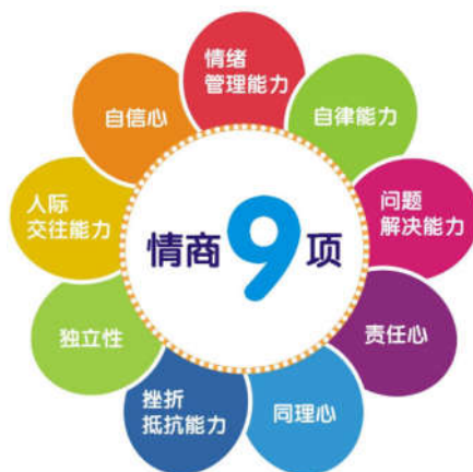
图1 幼儿情商示意图

为，幼儿教师给予幼儿充分的尊重，不得因任何原因对幼儿所提出的想法进行反驳，如果发现幼儿所提出的想法有悖常理，教师需要对幼儿进行正向引导，告知幼儿该种想法所产生的结果，使幼儿直观地了解到该种想法的错误性，并及时地进行纠正。值得注意的是，教师不能够在幼儿提出想法的开始就否定幼儿的想法，当幼儿自己认识到想法的错误之后，教师要及时地对其进行表彰鼓励，从而增强其自主思考自信心。其三为，幼儿教师需要，明确现阶段幼儿教育的核心是培养幼儿的核心价值观，并以此为依据，进行各类教学方案的制定，同时在课上还要积极主动地去探寻幼儿的学习需求，并引导幼儿表达出自己的观点，从而凸显出幼儿在课上的主体地位 [5] 。具体而言，自信心属于幼儿9项情商的重要组成部分，当幼儿的自信心提升之后，相应的其他几项情商也会有所提升。下图1为幼儿9项情商示意图。