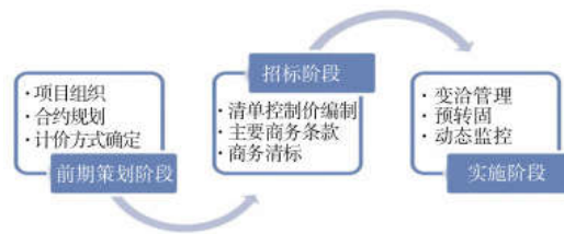
图1 项目全过程造价管控模型

估的科学性。建设单位坚持全过程造价管理, 能够使成本估算方法更加科学, 结果更加准确, 管理效果更加突出。工程项目全过程造价管理是通过减少影响工程项目全生命周期质量的各种经济因素来确保建设项目投资的合理性, 提高处理程序的规范性, 提高财务监督方案的可行性。另外, 工程项目全过程造价管理还可以进一步细化造价指标, 当成本指标细化后, 工程造价管理责任监督体系的有效性将进一步提升, 这为实现建设工程经济管理目标奠定了基础。在工程项目全过程造价管理过程中, 建设单位能够对内外部因素进行集中管理与分析, 从而在一定程度上提高预算编制的合理性和准确性 [1] 。除此之外, 工程项目全过程造价管理在提升预算方案的实施效果以及造价管理的灵活性等方面也起到了一定的作用, 如图1。