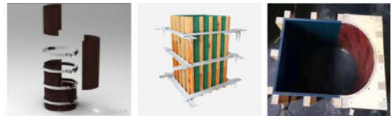
图4 圆柱模板 图5 方柱模板 图6 异型柱模板

型钢混凝土柱有圆柱、方柱、异形柱，模板均由模板厂家按照图纸制作，柱模板采用对拉螺杆(Φ16)@400加固，型钢柱经设计同意后按照螺杆间距由型钢柱厂家开孔，后附柱边长2000m、2400m、2800mXGZ(圆改方)柱模板(支撑不等间距)计算书。