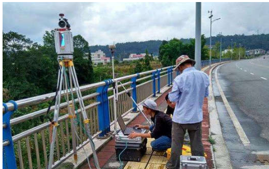
图3 三维激光扫描技术

主动的运用现代化的技术不是说盲目的引进, 应该要根据市场经济与水文勘察这一工作当下的实施情况开展对信息技术的引进与运用, 确保引进的技术可以更好地提升水文勘测这一工作的效率, 并且还可以给水利工程带来更多的经济效益, 如图3所示。