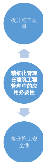
图1 精细化管理在建筑工程管理中的应用必要性

在当前的建筑项目实际管理过程当中，将精细化管理方法充分运用其中至关重要。能够保证工程项目整体建设的可靠性以及安全性，保证建设质量以及实际成效，这对促进我国建筑企业的健康可持续发展起着十分重要的作用 [2] 。因此，在项目管理当中运用精细化管理方法具备一定程度上的必要性，其主要体现在图1。