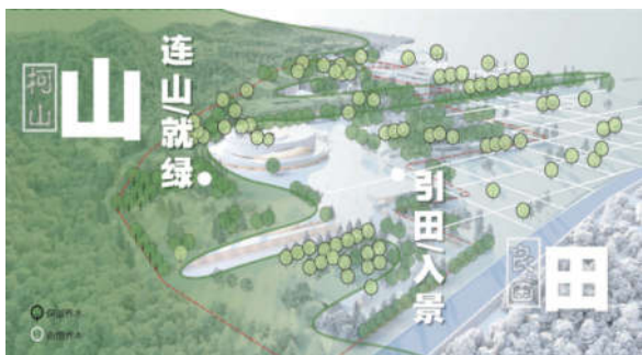
图2 围棋公园山水田融合格局效果图

针对场地“东南高、西北低”、雨季易积水的问题，设计采用引渠水活化场地的同时排解洪涝。在西侧校园入口广场低洼处新建快速渗水设施，雨季协助快速排水蓄洪，结合观赏和互动景观水体形成水绿交融的场地基底，既活化了场地空间，又提升了园区的生态品质。