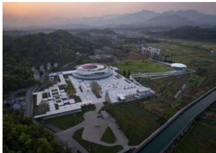
图1 改造后的世界围棋公园

恍世觅仙,衢州名山,烂柯山作为网红“旅游IP”,象征着衢州的山水与历史,其围棋文化特色是烂柯山旅游区的核心吸引力。衢州高级中学旧校园作为本次研究的案例,位于烂柯山旅游区的起点,是连接城市与烂柯山景区的重要节点,也是围棋特色的开放门户。本次改造将闲置校园转型为世界围棋公园,既破解了校园闲置难题,又补齐了景区文化体验与配套服务短板,实现了存量更新、文旅融合与文脉传承的多重目标,具有典型的实践示范意义。