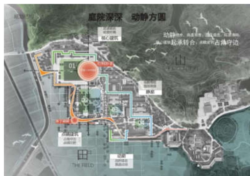
图3 双廊系统规划图

动廊以“似云似水”为设计理念，造型飘逸灵动，串联改造建筑及活动场地，与园区内水系相伴而行，适合游客休闲漫步和互动体验。静廊则从园林中汲取概念，以“游园逸梦”为设计理念，打造游园式的园林体验，在旧建筑之外，通过廊、庭、绿、厅的空间层次设计，营造出雅致、静谧的氛围，适合研学思考和休闲静养。两条廊道动静结合、曲直有度，限定出层层叠院，空间大开大合，将山景、田野引入园中，实现山田一体、交相辉映的空间效果 [1] 。