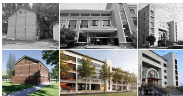
图6 园区既有建筑更新改造效果图

原有两栋学生宿舍被改造为围棋主题酒店，我们在他们之间加建了多层连廊和一层公共空间，围合出多个生活庭院。宿舍本身以刷新为主，重点改造山墙，形成园区展示基底。